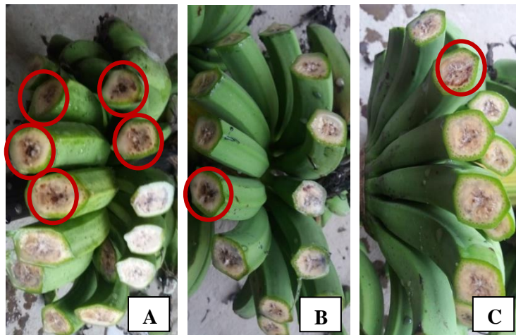
Gambar 2. Gejala penyakit darah pada buah pisang Raja Bulu yang diinokulasi dengan R. solanacearum melalui bunga pisang: A) Tanpa perlakuan bakteri endofit; B) Aplikasi isolat bakteri endofit EAL15; dan C) Aplikasi isolat bakteri endofit EKK22. Lingkaran merah adalah buah pisang yang menunjukkan gejala penyakit darah

Bakteri endofit yang diaplikasi pada perakaran tanaman pisang melakukan kolonisasi pada rizosfer dan semua jaringan tanaman pisang. Hasil penelitian Marwan et al. (2012) menunjukkan bahwa bakteri endofit EAL15-Rif (mutan bakteri endofit EAL-15 yang telah resisten terhadap antibiotik Rifampisin) telah terdeteksi di dalam jaringan akar pada 3 hari setelah inokulasi, sedangkan di dalam jaringan bonggol terdeteksi pada 4 minggu setelah inokulasi. Hasil analisis populasi bakteri endofit EAL15-Rif pada 3 hari setelah perlakuan menunjukkan bahwa populasi bakteri di rizosfer dan permukaan akar lebih tinggi dibandingkan dengan populasi bakteri di dalam jaringan akar berada di ruang antar sel tanaman memproduksi senyawa yang dapat mengaktifkan respon pertahanan.