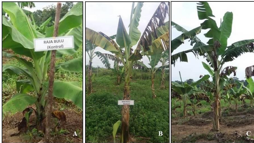
Gambar 1. Uji aplikasi bakteri endofit pada pisang Raja Bulu di lapangan : (A) Tanaman umur 3 bulan setelah tanam; (B) Tanaman bergejala penyakit darah yang diinokulasi dengan R. solanacearum ; (C) Tanaman diinokulasi dengan air steril