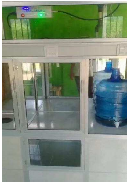
Gambar 3. Proses Produksi Air Minum

Hasil dari kegiatan ini adalah terproduksinya air minum yang digunakan untuk kebutuhan sehari-hari santri Ma'had Rizqullah dan juga untuk kebutuhan masyarakat sekitar Pondok pesantren. Selain mendapatkan air minum, pondok pesantren juga berkesempatan menambah income nya melalui kegiatan produksi air minum untuk masyarakat sekitar.