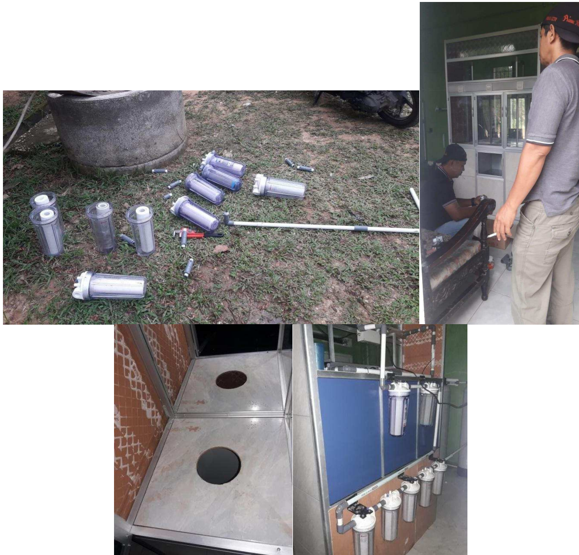
Gambar 2. Proses Pemasangan Instalasi Air Minum