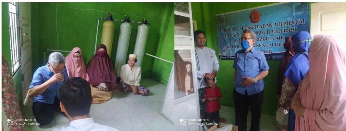
Gambar 4. Dokumentasi Kegiatan Penyuluhan dan Pendampingan

Hasil dari kegiatan ini adalah terproduksinya air minum yang digunakan untuk kebutuhan sehari-hari santri Ma'had Rizqullah dan juga untuk kebutuhan masyarakat sekitar Pondok pesantren. Selain mendapatkan air minum, pondok pesantren juga berkesempatan menambah income nya melalui kegiatan produksi air minum untuk masyarakat sekitar.