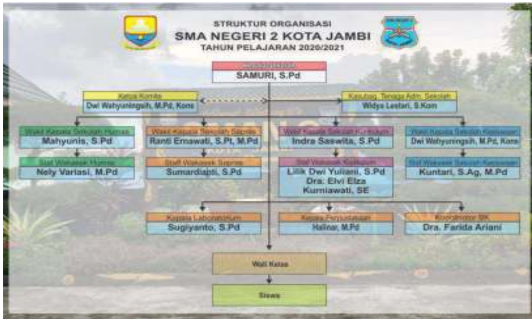
Gambar 4.6 Bagan Organisasi SMAN 2 Kota Jambi

Pada struktur organisasi di sman 2 kota jambi dimana siswa langsung dibimbing dan diperhatikan oleh walikelas pada kelas masing-masing. Sehingga guru mata pelajaran memberikan informasi kepada walikelas tentang siswa yang memiliki tingkat kedisiplinan dalam mengerjakan tugas rendah. Apabila peringatan dan pemberitahuan yang dilakukan walikelas tidak diindahkan oleh siswa makan walikelas akan melaporkan tindakan tersebut kepada koordinator Bimbingan Konselig, untuk dapat diperhatikan dicari alasan mengapa dan kenaps siswa tersebut tingkat kedisiplinan rendah saat mengerjakan tugas selama pembelajaran daring dilaksanakan.