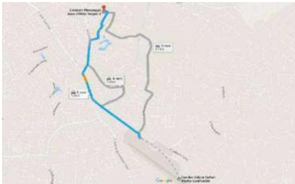
Gambar 4.5 Maps SMAN 2 Kota Jambi

Titika koordinat lokasi penelitian yang dilaksanakan penulis berada pada posisi geografi -1.607715 Lintang Selatan dan 103, 6328833 Bujur Timur.