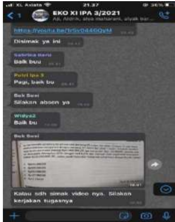
Gambar 4.10 Pembagian link materi pembelajaran melalui whatsapp grup .

Sehingga pada hari Kamis guru mata pelajaran memberikan tugas pilihan ganda melalui google form yang diberikan tenggang waktu pengerjaan selama 3 hari sejak tugas tersebut diberikan kepada siswa. Pada kelas XI IPA 3 terdapat 36 siswa, tetapi yang mengerjakan tugas hanya 32 orang siswa. Dari 32 orang siswa tersebut terdapat 6 siswa yang mengumpulkan tugas terlambat dari tenggang waktu yang telah diberikan oleh guru mata pelajaran. Bukan hanya siswa yang terlambat tetapi terdapat juga 5 orang siswa yang bahkan tidak mengerjakan tugas yang telah diberikan oleh guru mata pelajaran, data tersebut dapat dilihat pada Tabel 4.1 dan juga pada Tabel 4.2 yang telah penulis cantumkan.