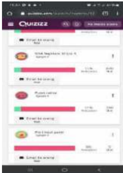
Gambar 4.12. Kesesuain Siswa mengerjakan latihan di Quizzy

Terdapat beberapa siswa yang mengerjakan tugas hanya sekedarnya saja bahkan menjawab pertanyaan dengan ketepatan dibawah 50% yang artinya dari 10 soal hanya benar sekitar 4 atau 3 soal saja. Dapat dilihat pada gambar 4.12.