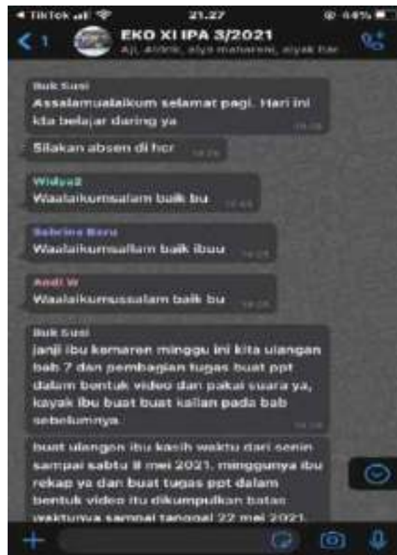
Gambar 4.11 Pemberitahuan Tenggang waktu yang diberikan guru mapel

Bukan saja guru mata pelajaran yang mengingatkan tentang pengerjaan tugas dan juga tenggang waktu kepada siswa, walikelas ikut berperan dalam mengingatkan siswa untuk mengerjakan tugas dan juga pengumpulan tugas. Seperti yang telah dijelaskan ibu Afrianita Simatupang :