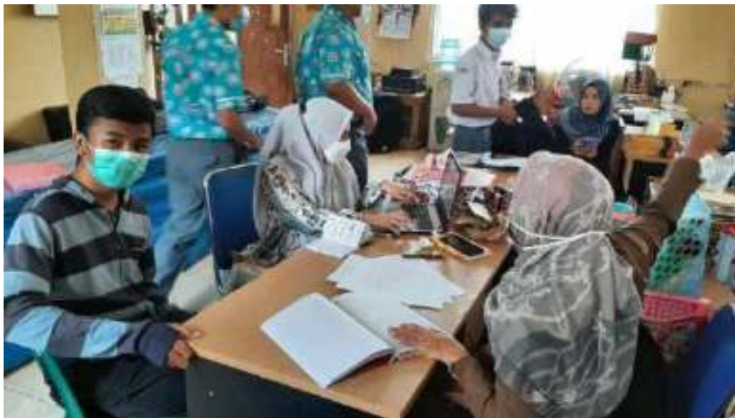
Gambar 4.14. Siswa menandatangani surat perjanjian di Semester ganjil

Pada semester ganjil hanya beberapa siswa saja yang dapat dipanggil oleh guru mata pelajaran untuk dapat bertanggung jawab atas tugas yang telah menjadi kewajiban bagi siswa, setelah menulis surat perjanjian maka guru mata pelajaran akan memperhatikan dan memberikan tenggang waktu dalam pengerjaan tugas yang terlambat dikerjakan oleh siswa tersebut.