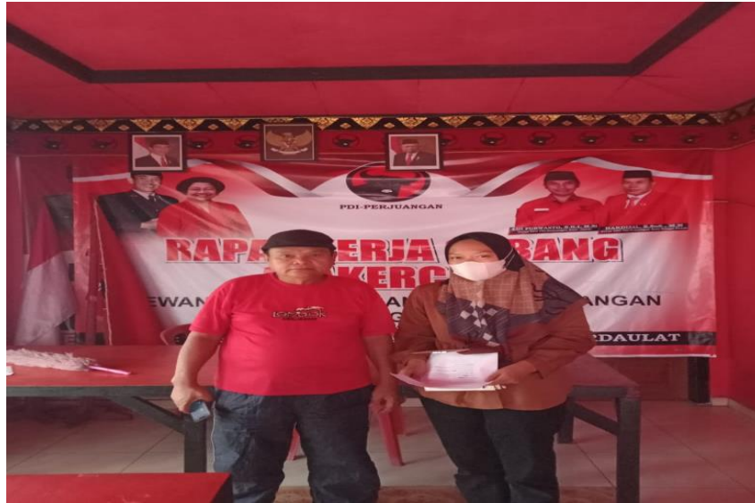
Dokumentasi : Wawancara dengan Kader PDIP Kota Sungai Penuh.