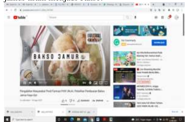
Gambar 3. Tutorial pembuatan bakso jamur yang sudah upload di youtube

Tahapan kegiatan selanjutnya diikuti dengan kegiatan menampilkan video proses pembuatan yang juga dapat diakses kembali melalui youtube ketika acara telah selesai dilakukan. Hal ini bertujuan untuk meningkatkan pemahaman anak panti dan mahasiswa yang mengikuti kegiatan tentang cara pengolahan jamur tiram menjadi bakso.