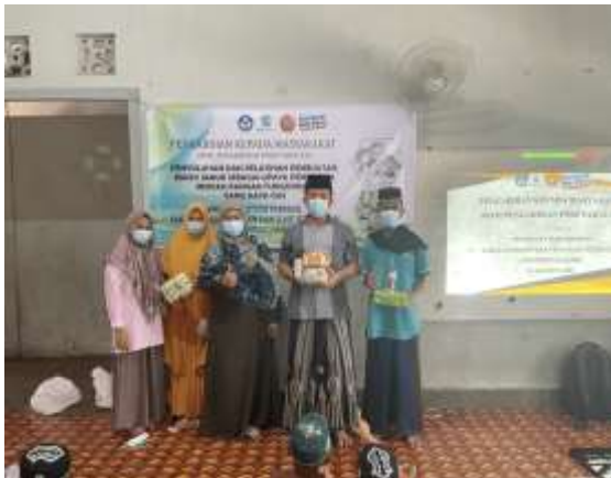
Gambar 1. Kegiatan Offline

Kegiatan ini dilakukan dengan kombinasi yaitu secara offline dan online hal ini bertujuan untuk mengurangi jumlah kerumunan sebagai upaya pencegahan penyebaran Covid-19. Kegiatan ini dihadiri di hadirinya sebanyak 35 orang peserta baik secara offline maupun online .