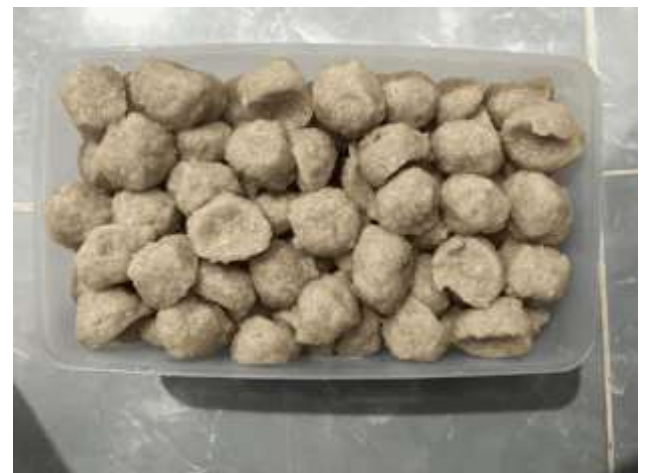
Gambar 4. Bakso Jamur Tiram

Selama kegiatan berlangsung peserta sangat antusias mengikuti seluruh kegiatan yang karena menjadi pengetahuan baru bagi mereka untuk mengolah bakso jamur tiram. Diharapkan dari hasil kegiatan ini akan menjadi ide usaha bagi anak panti asuhan baiturrahman dan mahasiswa himafar. Hal ini terlihat dari banyaknya jumlah pertanyaan yang diajukan oleh